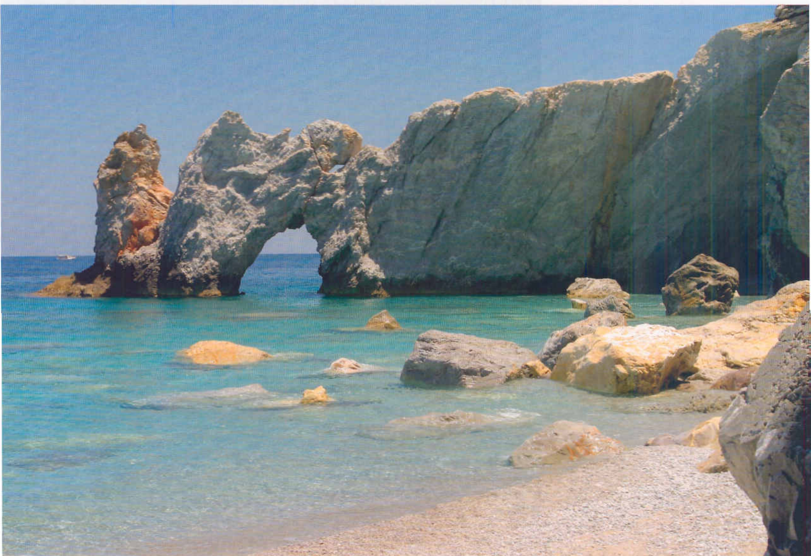
På stranden ved Lalaria er udsigten flot både over og under vandoverfladen.