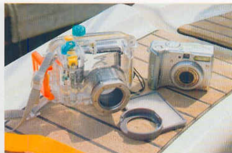
Med et undervandshus som ekstraudstyr til kameraet blev det sjovt at jage motiver under vandet.

Men kort efter vores ankomst begyndte turistbådene at sejle ind på stranden, for at hente deres medbragte last af turister tilbage til deres hoteller på sydsiden af øen.