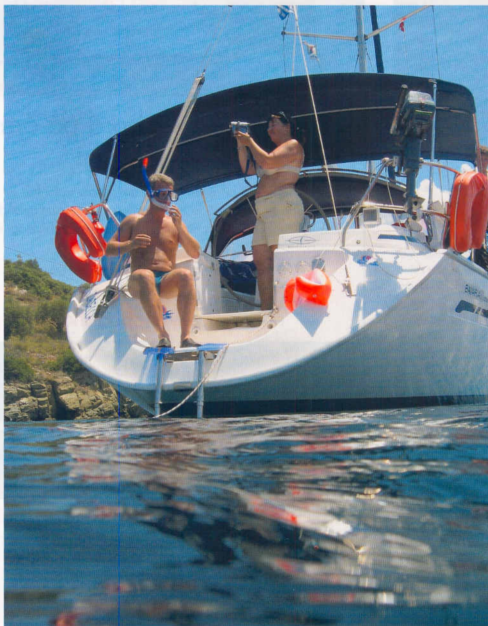
Vi gør klar til en dukkert i det varme vand.