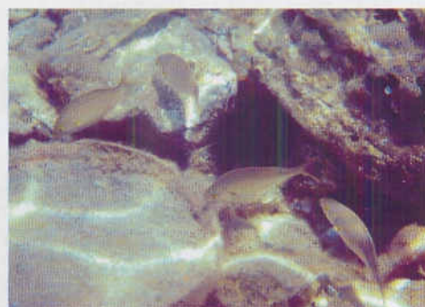
Vi blev aldrig trætte af at betragte fiskelivet og søpindsvinene.

ninger har skabt et stort hul i klippen, er et tilsvarende hul, som er skjult under havoverfladen. Med vores snorkler var det muligt at nyde dette flotte undervandslandskab, hvor der også hele tiden samledes en masse fisk.